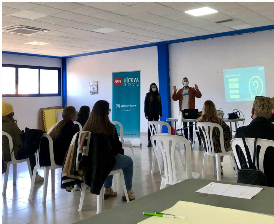
1a sessió del Fòrum Jove de Ròtova