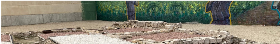
Detall de la Vil·la Romana de la Sort

Durant la pandèmia: entre d'altres, s'han repartit col·le-mantes als xiquets i xiquetes; s'ha distribuït el quadern d'activitats "Ara que estem a casa", editat per la Mancomunitat de Municipis de la Safor i Edicions 96; hem fomentat un entorn d'entrada i eixida segurs per al col·legi.